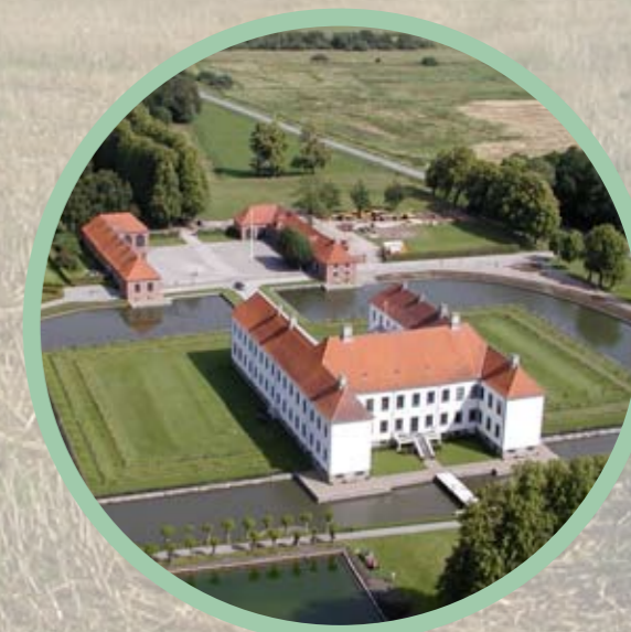
Voldum - en aktiv by i Østjylland!

Tæt på byen - tæt på dig og din familie!